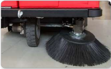
Braccio spazzola laterale Side brush arm Lateral izquierda