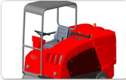
Tettuccio Canopy Techo