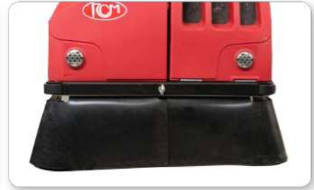
Convogliatore polvere Dust conveyer Encaminador de polvo